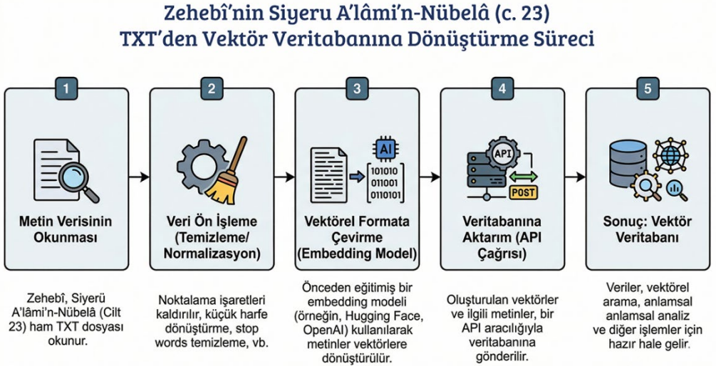
Şekil 1. TXT Dosyasını Vektörel Veri Tabanına Dönüştürme Süreci

düzenlemeler, ham metnin anlam bütünlüğünü bozmadan modelin doğrudan biyografik içeriğe odaklanmasını sağlamak amacıyla yapılmıştır. 25